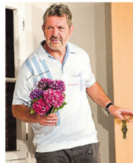
Uwe Barsig wird von Bernhard Best dargestellt.